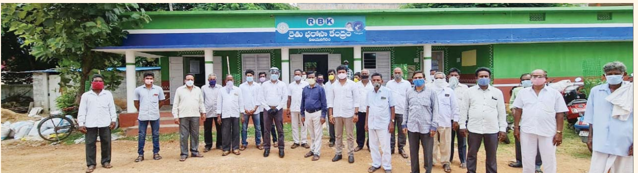
విజయనగరం రైతు భరోసా కేంద్రం వద్ద కస్టమ్ హైరింగ్ సెంటర్లను నెలకొల్పుతున్న రైతు సంఘాలు

గ్రామ స్థాయిలో యంత్ర పరికరాల బ్యాంకులను కస్టమ్ హైరింగ్ సెంటర్ల ఏర్పాట్ల కోసం చేయనున్నారు. ప్రతీ ఆర్.బి.కె. పరిధిలో ఎఫ్.పి.ఓ.లు/క్రాంత గ్రూపులలోని ఒక్కొక్క గ్రూపుకు 5 నుండి 6 మంది ఔత్సాహిక రైతులతో కూడిన (యువ రైతులకు ప్రాధాన్యం) ఒక సంఘాన్ని ఏర్పాటు చేస్తారు. వీరిలో యంత్రాలపై మరమ్మత్తులు అవగాహన ఉన్న వ్యక్తులకు ప్రాధాన్యత ఉంటుంది. ఈ కస్టమ్ హైరింగ్ సెంటర్లను ఆయా గ్రామల్లోనే ఏర్పాటు