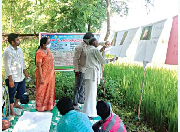
డా॥ వై.ఎస్.ఆర్. పొలంబడి కార్యక్రమాన్ని నిర్వహిస్తున్న గ్రామ వ్యవసాయ సహాయకులు