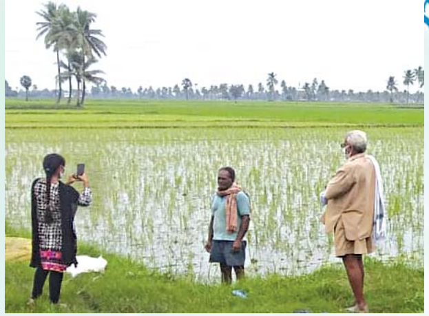
ఈ-పంట నమోదు చేస్తున్న గ్రామ వ్యవసాయ సహాయకులు