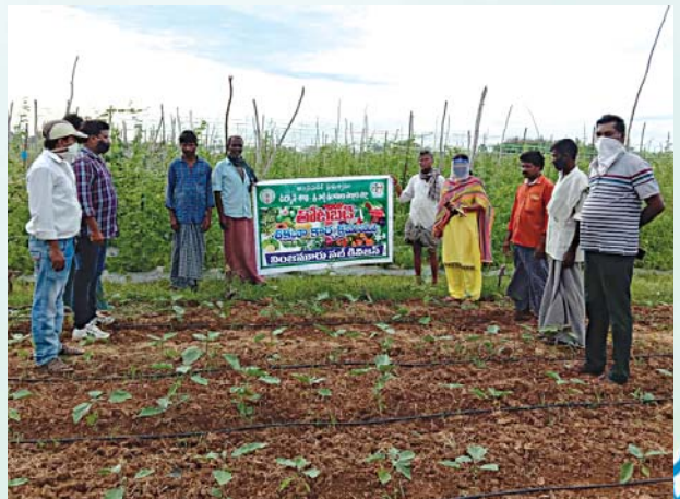
డా॥ వై.ఎస్.ఆర్. తోటబడి కార్యక్రమాన్ని నిర్వహిస్తున్న గ్రామ ఉద్యాన సహాయకులు